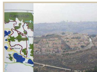
Iniciativa de Ginebra: Ramala y Asentamientos Judíos

Visita al Museo sobre "la costura" (línea fronteriza entre Israel y Jordania 1967), iniciativa que utiliza el arte como lenguaje universal para fomentar la coexistencia.