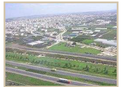
Cerca de separación entre Cisjordania e Israel

Vista panorámica sobre la zona más angosta de Israel. Análisis de la problemática de la profundidad estratégica. Visita a Kfar Saba, ciudad típica israelí y reflexión sobre la normalidad en un país que ha sufrido constantemente atentados terroristas y guerras. Análisis de las diferencias en la vida cotidiana con respecto a países donde prevalece la paz. Visita al centro cultural y al monumento a los soldados caídos y a las víctimas del terrorismo.