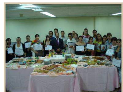
Ceremonia de clausura en el Instituto Internacional para el Liderazgo

La propuesta se ajustará al perfil del grupo, a causas de fuerza mayor y/o a los temas relevantes del momento.