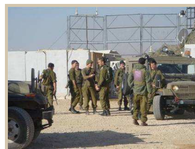
Visita a base militar

Presentación de proyectos voluntarios realizados por jóvenes universitarios para el desarrollo de zonas en conflicto y la integración de los distintos sectores de la población. Reflexión sobre el papel de los jóvenes en la construcción del país.