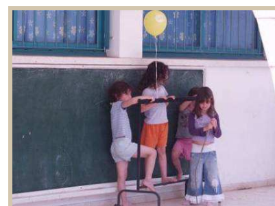
Niños árabes y judíos en escuela mixta en Kfar Kara

Encuentro con la organización que promueve el dialogo como solución, formada por padres palestinos e israelíes que perdieron a sus hijos en el conflicto.