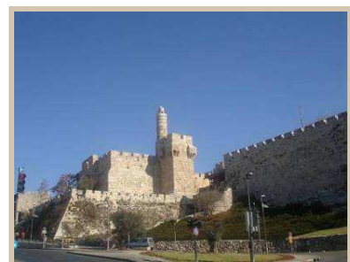
Murallas de la Ciudad Vieja de Jerusalem

Visitas al Museo de Israel, donde se encuentran los rollos del Mar Muerto y/o a otros museos. Paseo por lugares religiosos e históricos. Recorrido por la Ciudad Vieja. Compras personales en los mercados árabe y judío. Visita al centro moderno de la ciudad, donde hay gran diversidad de restaurantes, cafés, bares y negocios. Paseo nocturno por Jerusalem.