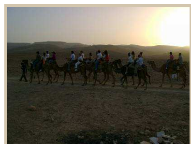
Paseo en Camellos en el Desierto de Judah

Visita a las Ruinas de Qumrán, aldea escenia donde se hallaron los manuscritos del Mar Muerto en los que se encuentran las versiones más antiguas descubiertas de textos bíblicos.