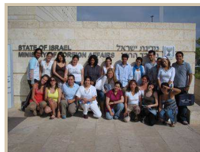
Visita al Ministerio de Relaciones Exteriores de Israel

Paseo en camello en el desierto, recibimiento beduino y muestra de las tradiciones de los nómadas en el desierto. Dinámica nocturna en el desierto, lugar en el cual se inspiraron muchos de los fundadores de las religiones monoteístas. Pernoctación en carpa beduina.