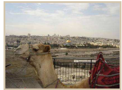
Ciudad Vieja de Jerusalem

Encuentro con estudiantes judíos y árabes del campus universitario donde se encuentra el Instituto.