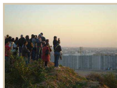
Punto de observación de Gaza

Panel con jóvenes representantes de distintos partidos políticos y sectores de la sociedad. Debate sobre la situación actual del país y su futuro.