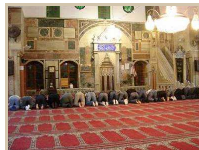
Rezo árabe en la mezquita de Acco

Análisis comparativo de la realidad de la población árabe en Israel y en los países árabes.