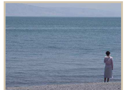
Mar de Galilea

Visita a Galilea, cuna del cristianismo. Recorrido por Nazaret, ciudad con mayoría árabe y lugar donde se desarrolló la infancia y juventud de Jesús. Visitas a: la Basílica de la Anunciación y a la Iglesia de San José; Río Jordán (Yardenit), donde se conmemora el bautismo de Jesús; Mar de Galilea, Iglesia del primado de San Pedro, donde Jesús caminó sobre el agua; Monte de las Bienaventuranzas, donde Jesús pronunció el Sermón de la Montaña.