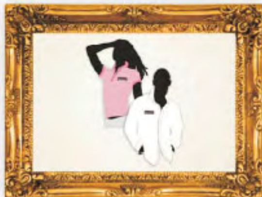
Diseño de manual de identidad Tribuna de San Luis

Estos y los de la página anterior son algunos de mis proyectos profesionales realizados durante mi periodo universitario, pero aun así la mayoría vendidos a clientes como freelance o como empleado de una agencia. Son también estos parte de mis logros y orgullos.