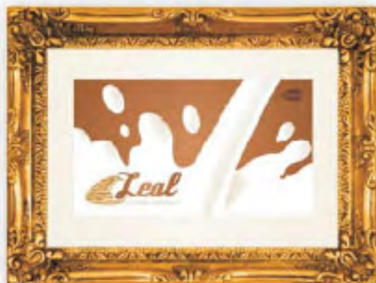
Imagen corporativa Leal leche de almendras